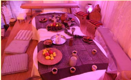
Kana in Lützellinden

Geht das gut? Ich war echt skeptisch, ob es in Lützellinden gelingt Mbj durchzuführen. War es doch die dritte Ausstellung in nur drei Jahren in einem Umkreis von 10 km. Es ging mehr als gut! Ich bin Gott sehr dankbar für die gelungene Ausstellung und die hoch motivierten Mitarbeiter! Über 1.300 Besucher haben sich einladen lassen. Ein Junge hat die Ausstellung viermal besucht und immer neue Leute mitgebracht. Herrlich!!