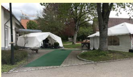
Zelt der Begegnung vor dem Gemeindehaus